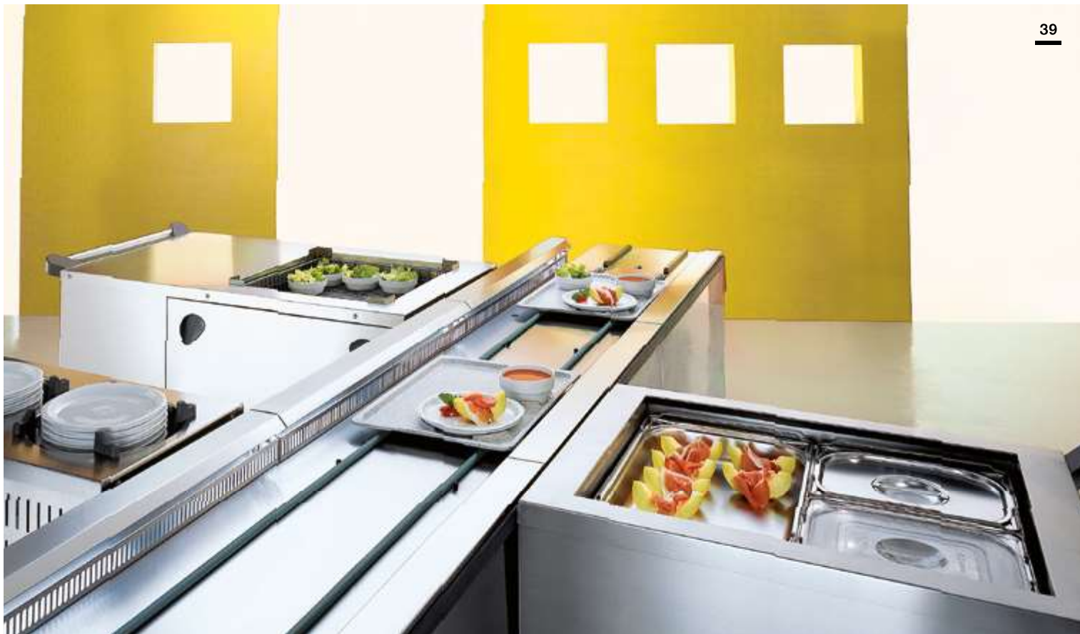
Trak za razdeljevanje hrane z ventilacijskim hlajenjem RSPV-UK